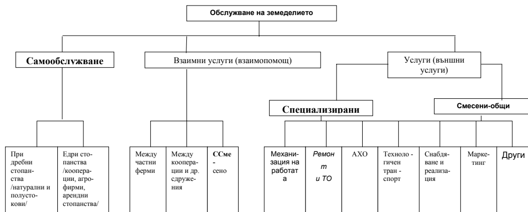
Форми на типа на обслужване в земеделието

Типовете производствено обслужване могат да се разглеждат като качествено различни управленски механизми за неговата организация със свои предимства и недостатъци по отношение на извършваните трансакции.