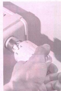
▲ Цената на парното нараства с близо 40% от 1 юли, а на тока - с 3,3%.

Поскъпването на тока ще бъде средно с 3,3%. За кли-