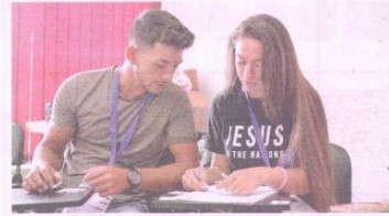
▲ Според икономистите от БАН са необходими програми, които да подпомогнат наемането на младежи.

сме до риска от стагфлация. В България рискът от стагфлация се обуславя от няколко неща. Едното е голямата разлика между високия ръст на инфлацията и прогнозата на нисък ръст на брутния вътрешен продукт за 2022 г. Тази разлика от 5-6 пъти е значителна. Това е едно от израженията на стагфлацията - много нисък ръст или задържане на ръста на икономиката и продължаващо нарастваща инфлация. Другият фактор, по който може да се съди дали се приближаваме към стагфлация, това са данните за пазара на труда - нивата на безработица и на заетост. Там все още нямаме негативна промяна, предстои да наблюдаваме как нещата ще се развият до края на годината. Много важен показател е и нивото на потребление - дали ще имаме задържане или спад във вътрешното търсене. Ако това е налице, също е индикатор за приближаваща стагфлация.