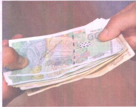
▲ Въвеждането на необлагаем минимум ще подкрепи покупателната способност на населението, смятат икономистите от БАН.

флационни мерки от страна на правителството, ключово се явява развиването на производствения капацитет на реалния сектор за осигуряване на по-високи доходи, докато тяхното базиране предимно на компенсирането на загубата на покупателна способност поради по-високите цени може да доведе до макроикономическа дестабилизация и фискална неустойчивост. Така се създават условия за едновременно ускоряване на инфлацията и неблагоприятно развитие на бюджетните показатели, което би се отразило върху деклариранията цел за при-