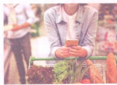
▲ Инфлацията в страната е по-висока от средната за ЕС заради спекула със стокоите от първа необходимост.

лен икономически ръст от 2% през 2022 г. Но заради високата инфлация през последните месеци брутният вътрешен продукт ще надхвърли 150 млрд. лв., което е увеличение с повече от 15% спрямо миналата година. През следващите години ръстът на БВП също ще бъде сравнително слаб. Инфлацията в края на 2022 г. обаче ще достигне 15,3% и то