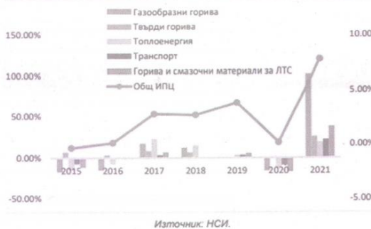
Фигура 14. Основни фактори на инфлацията в България

периода ще бъде по-висока от обичайната през последните години, като прогнозата е да е особено висока - близо 14% на средногодишна база, през 2022 г. Заетостта в страната ще продължи да се определя от темпа на икономическия растеж при ограничените, зададени от демографската ситуация в страната, докато безработицата се очаква леко да нарасне т.г., а впоследствие да спадне до обичайните си равнища от около 5% при преодоляване на процесите на стагфлация в икономиката.