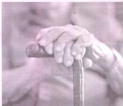
▲ В момента размерът на минималната пенсия се определя субективно, смятат икономистите от БАН.

не трябва да се дават само на най-бедните, а на всички родители, смятат още икономистите от БАН. Според тях помощите трябва да зависят от броя на децата и да има допълнителен бонус при преминаване на детето в по-горен клас в училище. Препоръката на БАН към управлява-