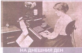
НА ДНЕСНИЯ ДЕН

► ЮЛИЯ НЕКОВА , председател на Комисията за защита на конкуренцията.